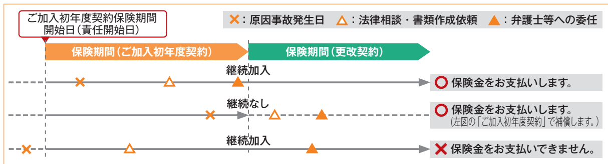
【保険責任の開始(原因事故発生日と保険期間との関係)(イメージ図)】